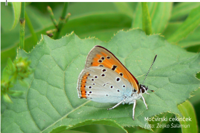
Močvirski cekinček