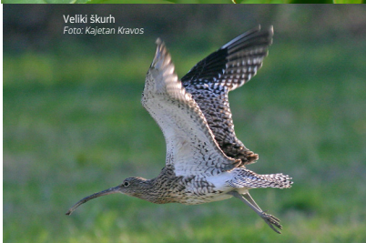
Veliki škurh