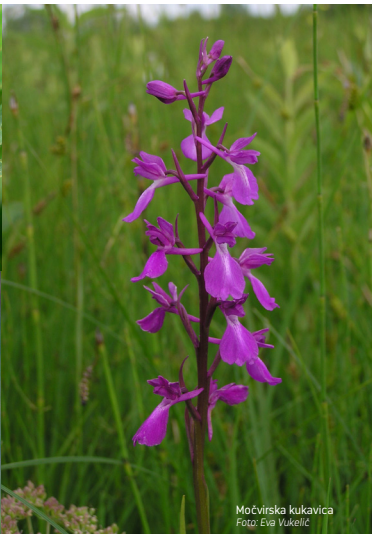
Močvirska kukavica